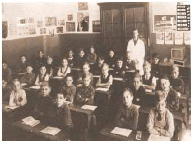
De school van vroeger is ideaal om de leerlingen van de eerste graad van het lager onderwijs te bekoren.

Voor leerlingen uit de eerste graad (en de oudste kleuters) staat het 'ontdekken' en 'kennis maken met' het eigen erfgoed en erfgoed van anderen in hun leefomgeving centraal. Kennisoverdracht en inzichten in het kader van cultureel erfgoed zijn hier nog niet de prioriteit. We moeten kansen creëren zodat kinderen zich kunnen verwonderen over het erfgoedaanbod in hun leefomgeving. Kinderen krijgen impulsen om erfgoed te exploreren en te onderzoeken met al hun zintuigen. En die ervaringen mogen ze dan ook uiten in allerlei expressievormen. Deze jonge kinderen hebben nog een zeer beperkte ervaring en inzicht in de 'historische tijd'. Ze hebben nog geen begrip van jaartallen en gebeurtenissen in een 'ver' verleden. Erfgoed gerelateerd aan de vorige generaties (ouders, grootouders en ev. overgrootouders) is wel mogelijk, maar houd rekening met het feit dat kinderen hun (over)grootouders jonger zijn dan de grootouders van de ontwikkelaars van het educatief aanbod. Door verhalen uit een 'verder' verleden laten kinderen zich fantasievol meevoeren naar een voor hen ongrijpbaar verleden. Thema's die aanspreken zijn vooral die erfgoedthema's die aansluiten bij het dagelijkse leven zodat de leerlingen zich kunnen inleven vanuit hun gekende wereld (bijvoorbeeld speelgoed, kleding, familiefoto's, feesten, rituelen, school...).