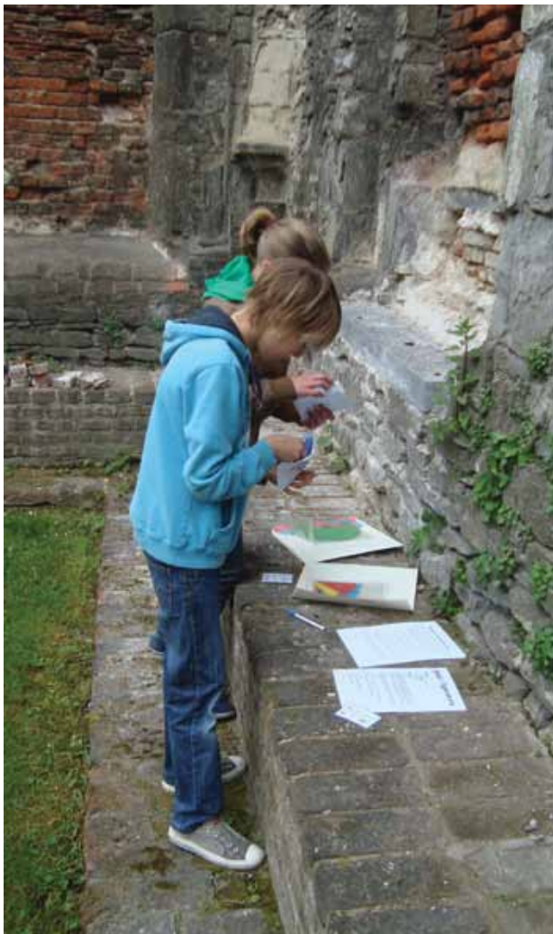
Kinderen aan het werk in de Sint-Baafsabdij in Gent.