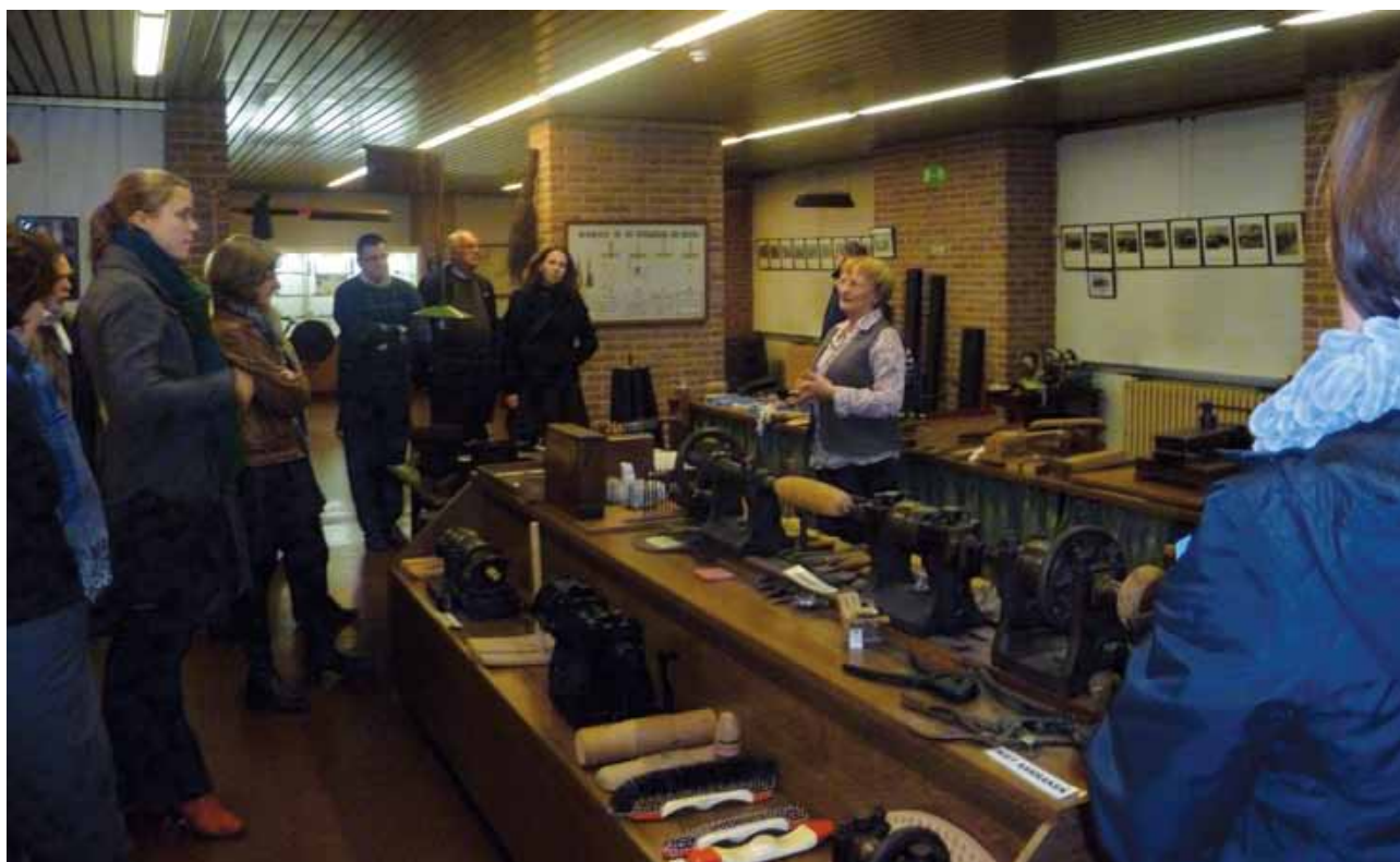
De deelnemers van de cursusreeks in Izegem krijgen uitleg over de educatieve rondleidingen in het Borstelmuseum.