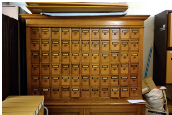
De kast met de Collectie Obreen achteraan tegen de muur van het ondergrondse depot van het Centraal Bureau voor Genealogie te Den Haag.

De collectie zit opgeborgen in een prachtig houten meubel, bestaande uit een bovenkast met 66 laden en een afgesloten onderkast. Ze staat helemaal achteraan tegen de muur van het ondergrondse depot van het CBG. Het precieze aantal steekkaarten is onbekend: de nota van Bik maakt gewag van 804.000 aantekeningen, maar dat lijkt overdreven. Een lade telt naar schatting 2.500 à 3.000 steekkaarten; via extrapolatie zou dit voor de bovenkast neerkomen op circa 165.000 à 198.000 steekkaarten. De sleutel van de onderkast is zoek, maar volgens de nota bevinden zich hierin 43 laden. Die bevatten een klein aantal beschreven en blanco fiches en een reeks gips- en wasafdrukken van zegels, maar zijn voor het overige leeg.