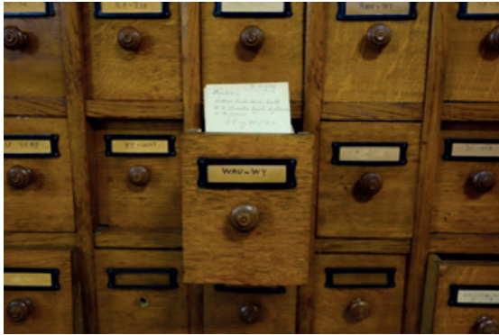
Lade met steekkaarten van de Collectie Obreen.

en documenten waaruit de informatie werd gehaald. Heel wat voornamen werden afgekort (Cath voor Catherine, Elisth voor Elisabeth, J.Bte voor Jean Baptiste) en systematisch verfranst.