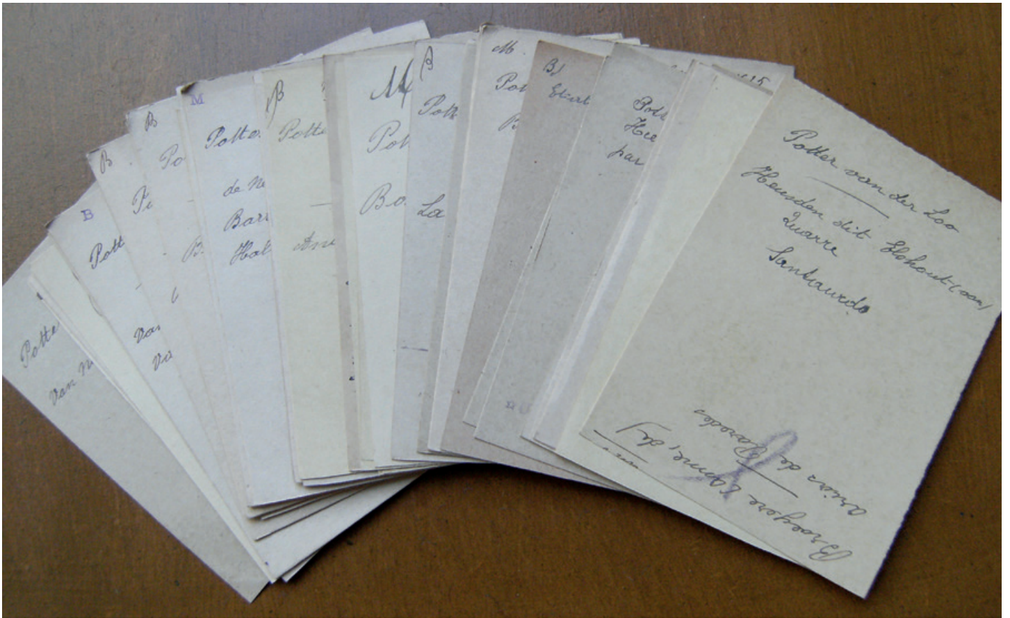
Steekkaarten uit de Collectie Obreen met de familienaam Potter.