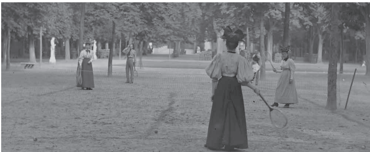
Une partie de tennis dans le parc. [1891]-[1900], Conseil dép. de la Manche, arch. dép. (fonds Daguene, 11Fi-73).