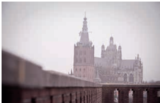
Zicht vanop het voormalig provinciehuis (locatie van Erfgoed Brabant).