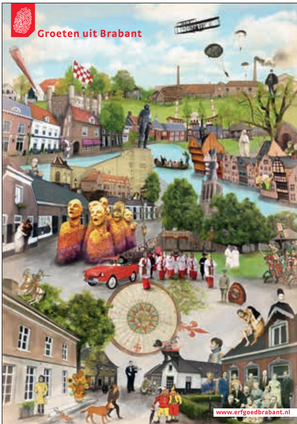
Voorzijde van schoolplaat voor het basisonderwijs