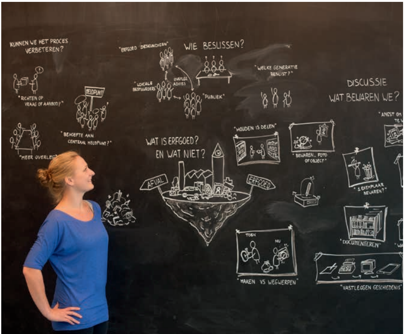
Workshop tijdens symposium "Is dit nou de selectie?", augustus 2014

slag rondom vragen over hun positionering in het erfgoedveld, vragen die bij heel veel kringen leven: wat betekenen we en wat willen we betekenen voor de gemeenschap? Hoe zorgen we ervoor dat we gezien worden? Hoe betrekken we nieuwe mensen bij ons werk? Door van dit traject verslag te doen in woord en beeld, en ook bijeenkomsten te organiseren, hopen we veel heemkundekringen te betrekken, te inspireren en uiteindelijk te versterken."