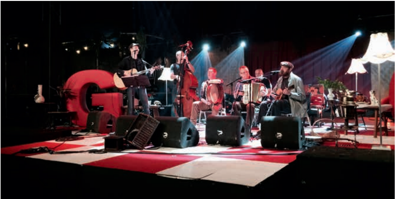
Theater van de Zachte G, dialectpodium van Erfgoed Brabant op Paaspop Schijndel 2015