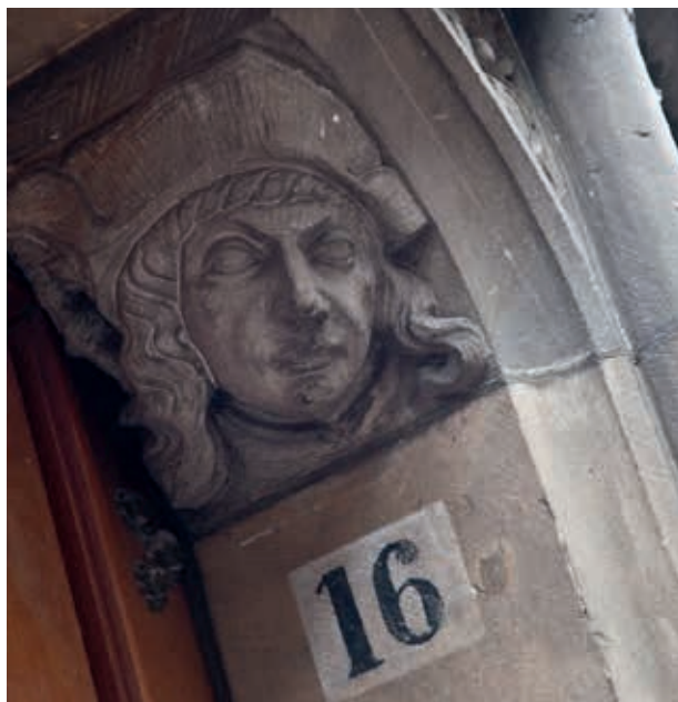
Detail van de ingang