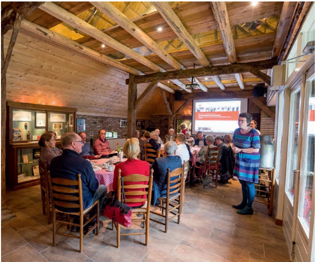
Netwerkbijeenkomst streekmuseum bij de Meierijsche Museumboerderij in Heeswijk-Dinther, september 2015

heeft zijn kennis en ervaringen over rondleiden gedeeld met de gidsen van MUBO. Wij willen dit ‘van-en-met-elkaar leren’ graag stimuleren. Ook het begeleidings-traject dat we met de streekmusea hebben opgezet staat op onze website. Dat project had specifiek tot doel om samen te leren door uitwisseling.”