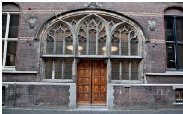
Ingang voormalig provinciehuis