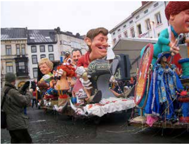
Een sfeerbeeld van Aalst Carnaval uit 2010

Oplossingen hiervoor worden voornamelijk gezocht in samenwerking. Soms gebeurt die noodgedwongen door grootschalige herindelingen. Lichtoptochten duiken op als een soort ‘light-versie’ van het carnaval, in meerdere betekenissen.