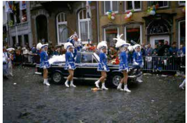
Carnaval te Halle in de jaren 1980

king van heemkringen. Door de krachten te bundelen kunnen carnavalisten en heemkundigen elkaars werking bijgevolg wederzijds versterken.