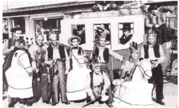
Carnaval te Blankenberge in 1953

ken aan te leren, tentoonstellingen over sleutelfiguren, educatief materiaal voor de lagere school en ga zo maar door. Van overheden wordt verwacht dat ze mensen die tradities in leven houden - de zogeheten traditiedragers - ondersteunen, trainen en adviseren. Maar erfgoedzorg overnemen mogen overheden niet. Zonder maatschappelijk draagvlak wordt immaterieel erfgoed immers een holle doos.