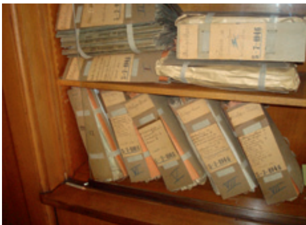
Een kast met een omvangrijk 'groepsdossier', in dit geval Belga Press.

Dit zijn allemaal verschillende zaken, die soms overlapt maar soms totaal naast elkaar liepen. De straatrepressie en de interne 'privé'-zuiveringen gingen bijvoorbeeld niet uit van de Belgische overheid. Wat ook bij 'de repressie' hoort, zijn alle verzachtende maatregelen na de veroordelingen of sancties: vervoegde en voorwaardelijke invrijheidstelling, genade, eerherstel (wet juni 1948) en rechterherstel (wet juni 1961). Deze maatregelen werden massaal toegepast. De overgrote meerderheid van veroordeelde collaborateurs verkreeg volledig eerherstel (en dus teruggave van alle politieke en burgerrechten). Wat nauwelijks bekend is, is dat tegen december 1950 meer dan 95% van alle veroordeelde collaborateurs in België alweer was vrijgelaten. In dit artikel, gaat het enkel om de gerechtelijke bestraffing en de administratieve zuivering.