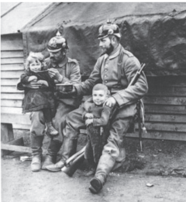
'De visie van de vijand' (Davidsfonds Uitgeverij)