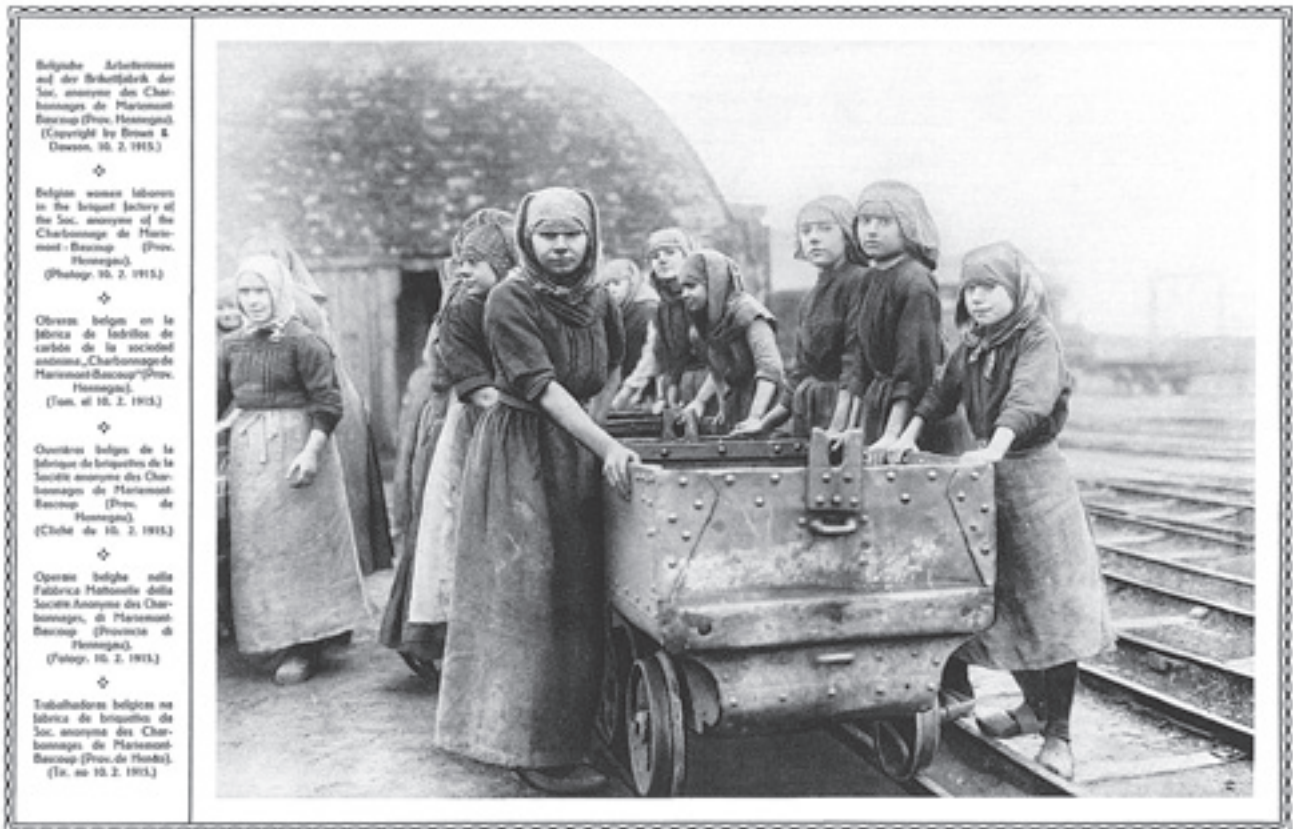
'De visie van de vijand' (Davidsfonds Uitgeverij)