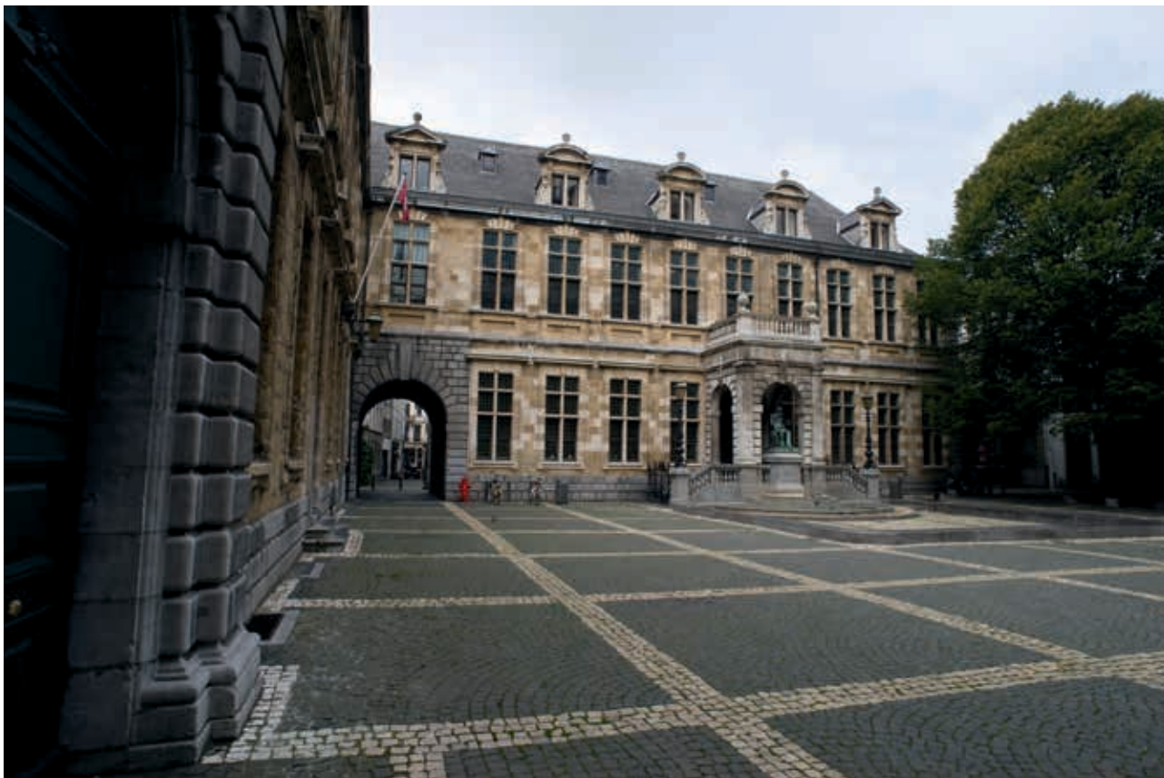
Zicht op de Erfgoedbibliotheek Hendrik Conscience, langs de kant van het Hendrik Conscienceplein

Heemkunde Vlaanderen ging bijgevolg op zoek naar een partner die op het vlak van bewaring en ontsluiting van dit soort documentair erfgoed voldoende expertise kon bewijzen en vond deze in de Stadsbibliotheek Antwerpen, die sinds 2008 Erfgoedbibliotheek Hendrik Conscience wordt genoemd.