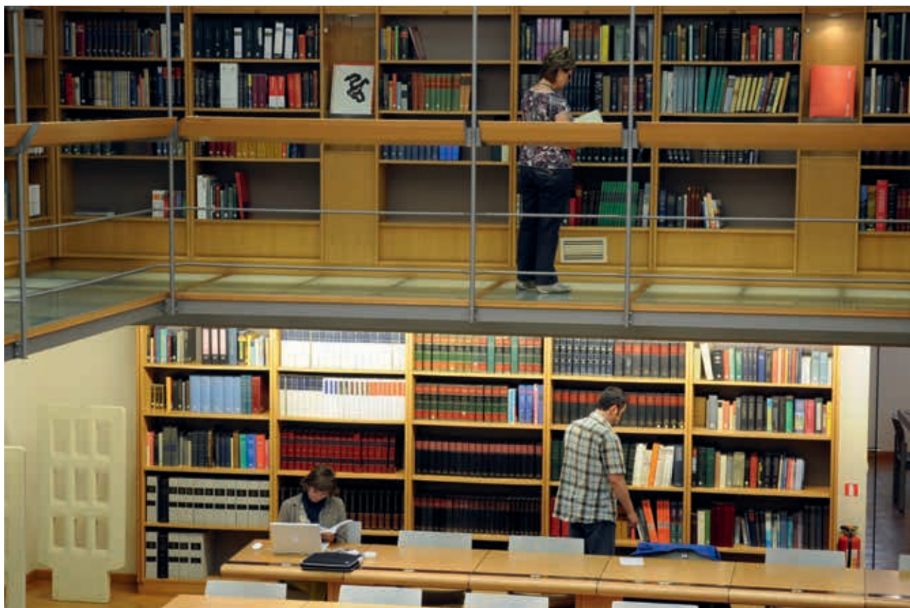
Blik in de leeszaal van de Erfgoedbibliotheek Hendrik Conscience