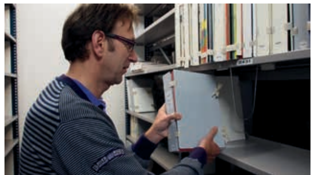
Tijdschriften worden in de Erfgoedbibliotheek in klimaatregelbare magazijnen bewaard