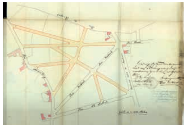
Kaart bij een Koninklijk Besluit uit 1887 betreffende de aanleg van wegen in de gemeente Berchem (latere fase).

Daarnaast zijn er ook (veelal latere) besluiten terug te vinden met betrekking tot de onbevaarbare waterlopen en de wateringen. Voor de onbevaarbare waterlopen hebben deze hoofdzakelijk betrekking op de goedkeuring van de provinciale reglementen en verbeteringswerken. Voor de wateringen slaan de besluiten onder meer op de goedkeuring van de oprichting, (de aanpassing van) hun begrenzing, hun huishoudelijk reglement en de benoeming van de dagelijkse besturen.