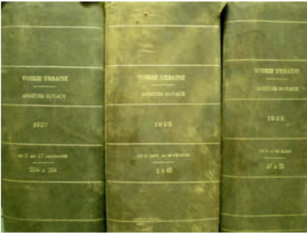
Chronologisch ingebonden Koninklijke Besluiten.

en de rol van lokale, provinciale en nationale overheden hierin te traceren. Vanzelfsprekend kunnen de besluiten ook gebruikt worden om een weg of bepaald gebied te onderzoeken.