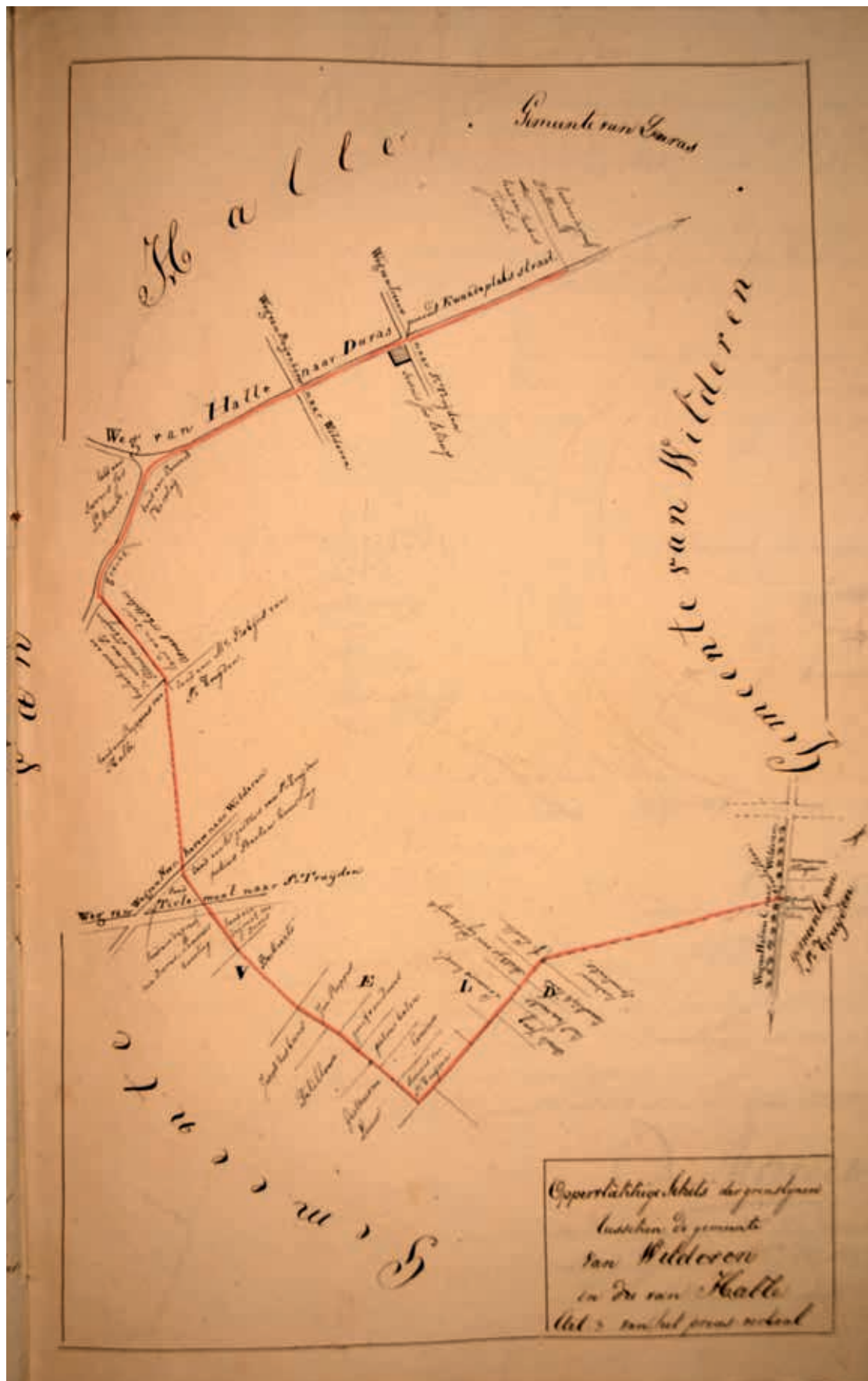
Schets van de grens van Wilderen met Halle. De grens loopt deels door het veld en volgt deels het traject van de Kwaadeplatstraat, die Halle met Duras verbindt.