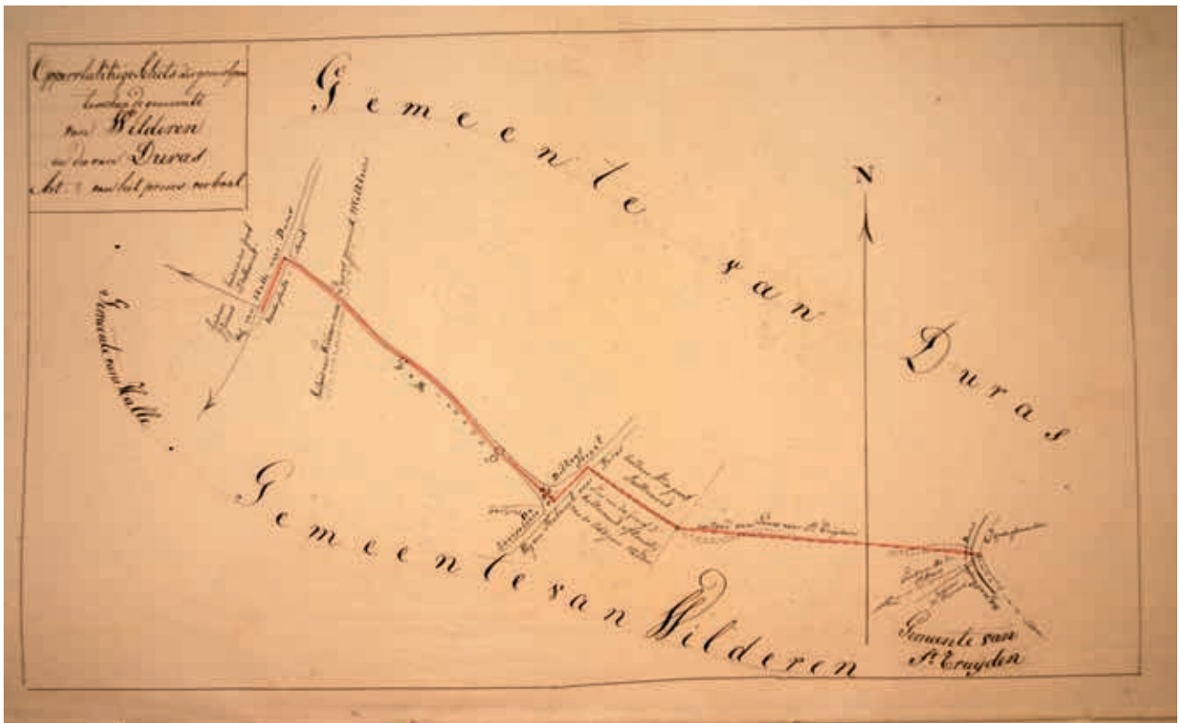
Schets van de grens van Wilderen met Duras. De grens volgt hier het traject van wegen en voetpaden: de Groene weg, de Keerselaerestraat, en het voetpad van Zoutleeuw naar Sint-Truiden tot waar dat uitkomt op de weg van Sint-Truiden naar Duras, en waar een groote gehouwe steen aangeeft dat daar een grens loopt.